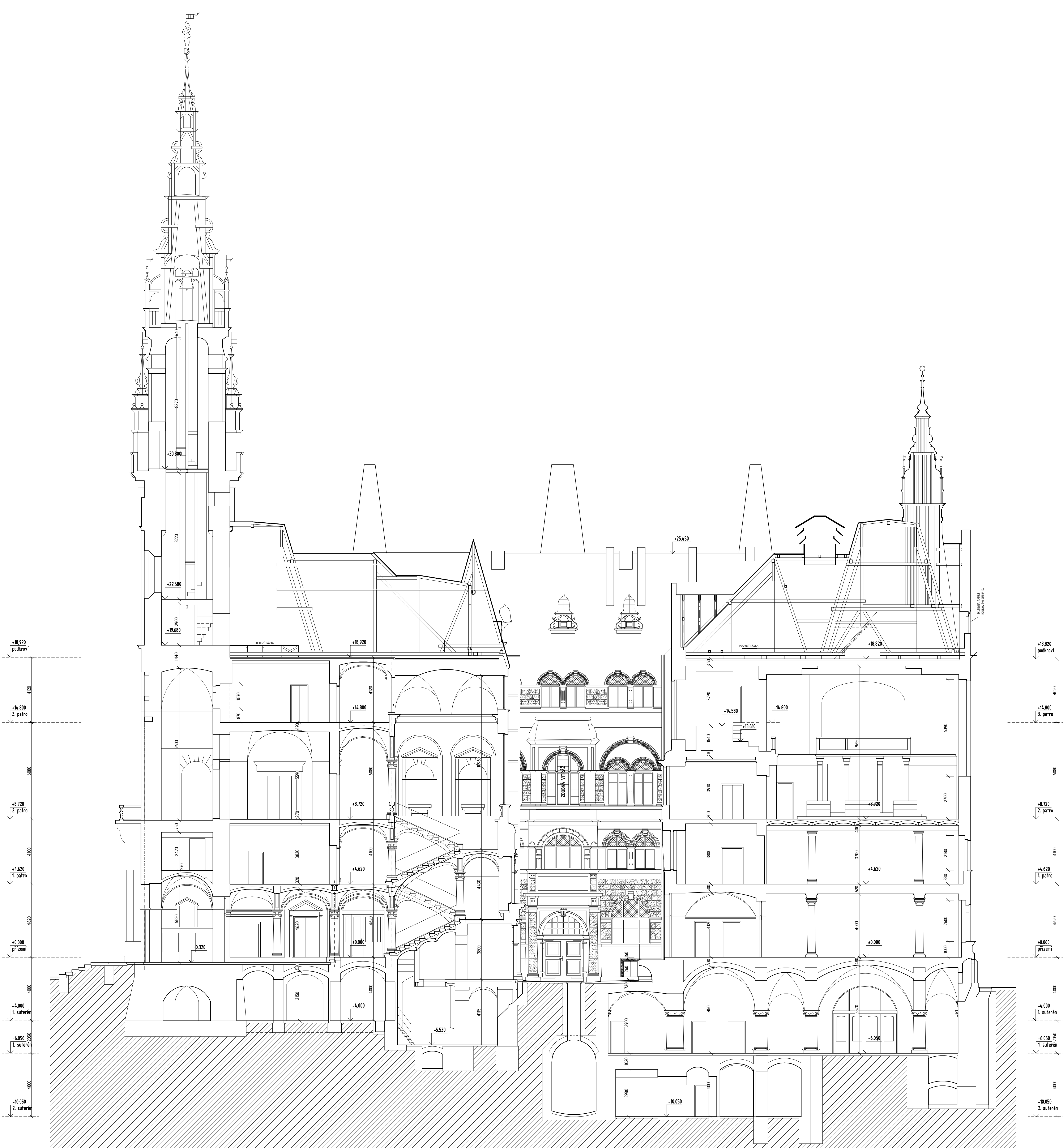
ŘEZ A-A, M 1:100

POZNÁMKY: - ZAMĚŘENÍ BYLO PROVEDENO ZA PLNÉHO PROVOZU OBJEKTU, MÍSTY S OMEZENÝM PŘÍSTUPEM ISTĚNY ZASTAVĚNÝ NÁBYTKEM A POD. - TLOUŠTKY OBVODOVÝCH STĚN JSOU PŘEVZATY Z PŮVODNÍ DOKUMENTACE. BEZ LEŠENÍ FASÁDY U ZDOBENÝCH OKEN NELZE DOHĚT CELÝ PROFIL A DOPROČÍTAT TLOUŠTKU STĚN. - ZÁKLADOVÉ KONSTRUKCE A JÍMKY NA VNITŘNÍM NÁDVORÍ JSOU PŘEVZATY Z PŮVODNÍ HISTORICKÉ DOKUMENTACE - VĚŽE JSOU KRESLENY POUZE ORIENTAČNĚ - FASÁDNÍ PRVKY (ŘÍHSTY, ŠAMBRÁNY, OZDOBNÉ PRVKY...) NEBYLY ZAMĚŘOVÁNY